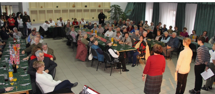
(A fotó a 2018-as idősek napján készült)

Az ENSZ közgyűlése nyilvánította október 1-ét az Idősek Világnapjává. Az Öregek Nemzetközi Napját az UNESCO vezette be 1991-ben. Ez az ünnep az idősekért van, róluk szól. Az időseket tisztelnünk kell. Tiszteletünk magában foglalja