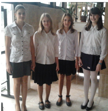
Arany minősítést nyertek