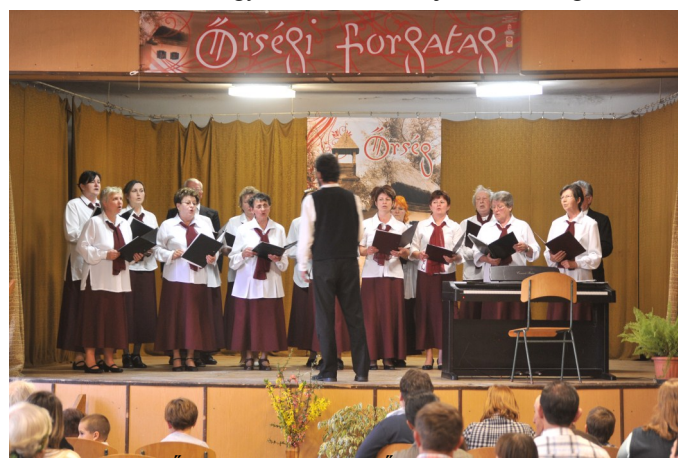
Őrségi forgasztáson az Őrségi Baráti Kar

Jelenleg 61 készülék van kihelyezve a rászorulóknál. A Magyar Vöröskereszt Zala Megyei Szervezete látja el az Őrségi Többcélú