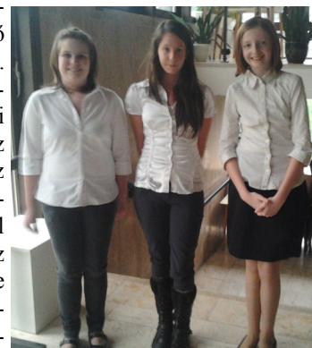
Arany minősítést nyertek