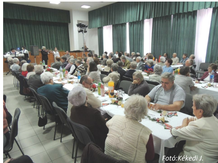
Fotó: Kékedi J.