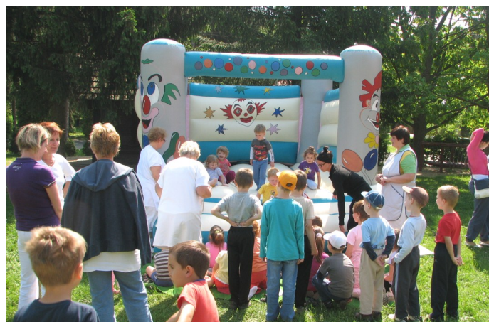
Egészségnap az óvodán

megállapodás alapján az Őrségi Többcélú Kistérségi Társulás koordinálja. Jelenleg két munkatárs végzi a program szakmai és pénzügyi lebonyolítását. A belső ellenőrzés az önkormányzatok belső ellenőrzési terve alapján került elvégzésre. 2012-ben a SZAHK-ÉRTELEM 2006. Bt. (Szántó és Társa Szolgáltató Bt. jogutód) megállapodás alapján végzi a feladatot. A mozgókönyvtári ellátásra a Faludi Ferenc Könyvtárral kötött megállapodás alapján kerül sor. A rendkívül sikeres Kistérségi Kulturális Forgasztást 2012-ben Viszákön, Bajánsenyén, Őriszentpéteren, Iváncon és Szalafön rendeztük meg. A Közkinccs-kerekasztal működtetése 2012-ben is folyamatos volt. Az Őrségi Többcélú Kistérségi Társulás törvényi szabályozásra hivatkozva 2012. december 31-el megszünteti Munkaszervezetét. A Munkaszervezet 2 dolgozója felmentési idejét tölti. Azonban a hatékony együttműködésre hivatkozva a települések az Őrségi Többcélú Kistérségi Társulás további fenntartása mellett döntöttek. Ennek az együttműködésnek a fő mozgatórugója a 2013. évi Kistérségi