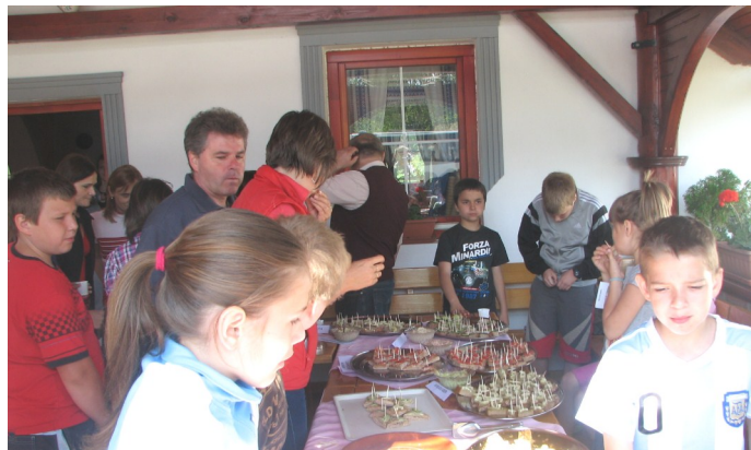
Egészségnap: diákok kóstolják az egészséges ételeket

minisztérium Közfoglalkoztatási Helyettes Államtitkárságához. A Belügyminiszter jóváhagyta 243 fő 2012. február 15-től 2012. december 31-ig történő foglalkoztatására irányuló igényt, melyet 109 376 287,- Ft támogatásban részesített. Jelen állapot szerint a Társulás 22 településén 73 fő foglalkoztatása zajlik. A program keretein belül munkaruházat, tárgyi eszközök, gépek, anyagok beszerzésre, valamint gépi szolgáltatások elvégzésre kerültek. A programot az önkormányzatokkal kötött Együttműködési