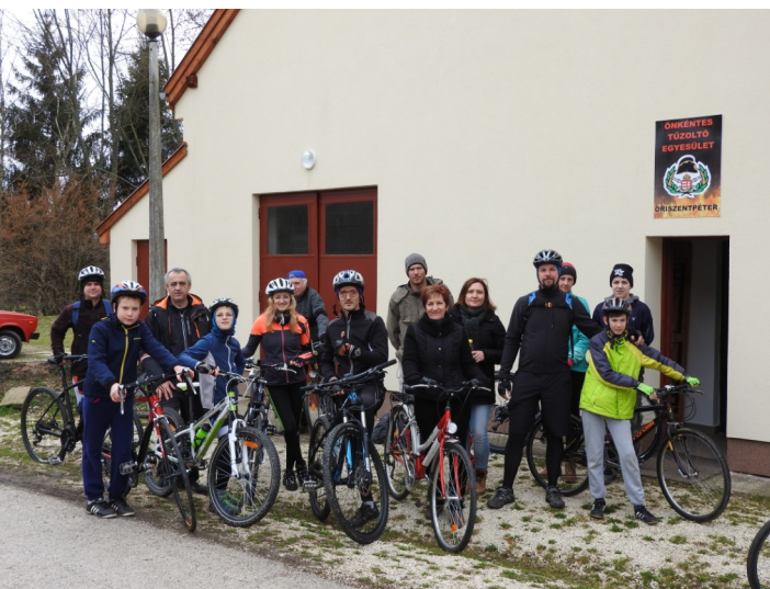
(a fotó az első túrára való induláskor készült)

Nemrégiben alakult meg Őriszentpéteren az Őrségi Kerékpáros és Természetbarát Egyesület. A régió legfiatalabb civil szerve-