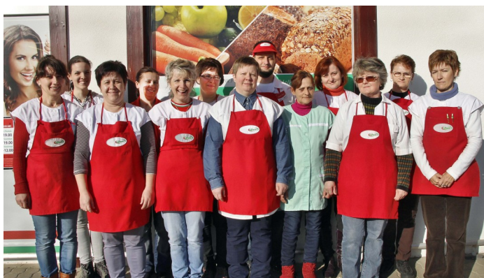
FE-ZO 8. sz. diszkont Óriszentpéter