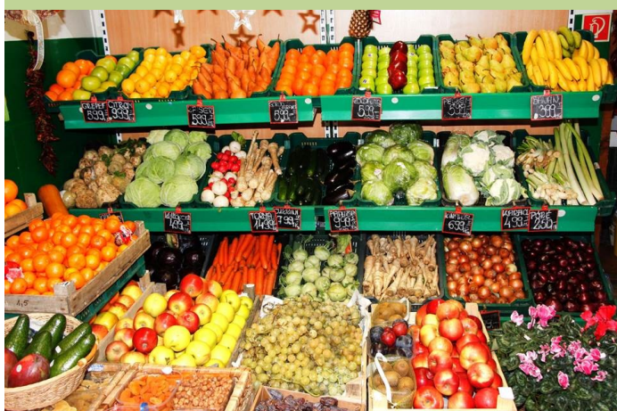
VIRÁG—ZÖLDSÉG—GYÜMÖLCS Kemenes Kert Kft.