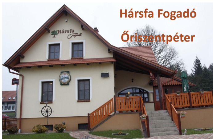
Hársfa Fogadó Óriszentpéter