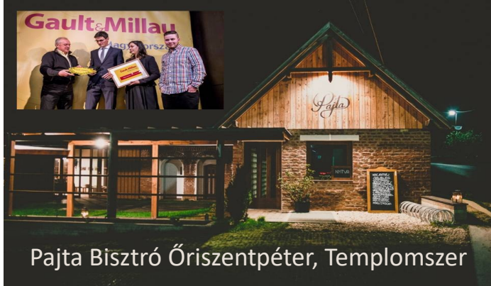
Pajta Bisztró Óriszentpéter, Templomszer