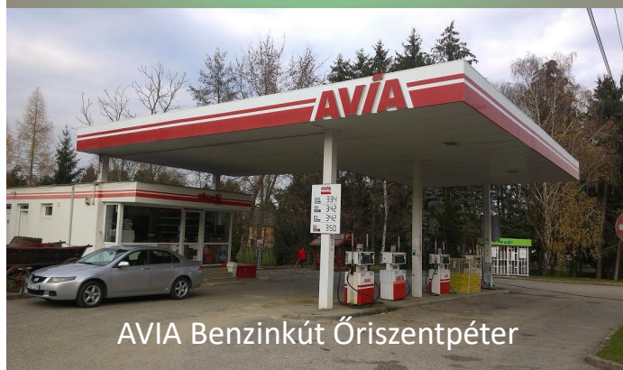
AVIA Benzinkút Óriszentpéter