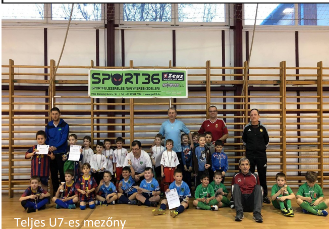
Teljes U7-es mezőny

8960 Lenti, Táncsics M. u. 2/a • furdo@lenti.hu • www.lentifurdo.hu • www.fb.com/lentifurdo